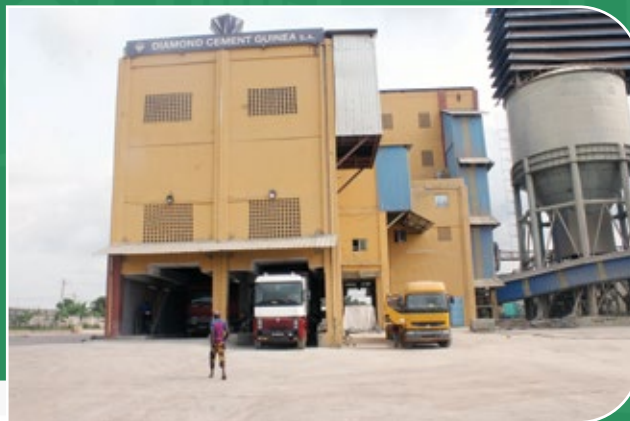
Diamond Cement, Guinée