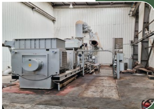
Centrales de Basse et Farafenni, Gambie