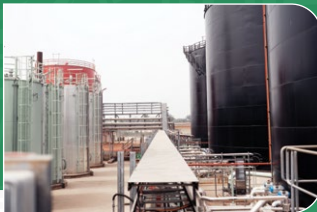
Centrale thermique de Maria Gléta, Bénin