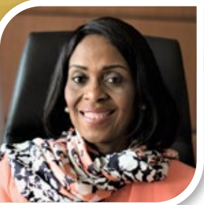
Mme. Kanayo AWANI

Vice-Présidente Exécutive, Intra-African Trade Bank, African Export-Import Bank, Afreximbank