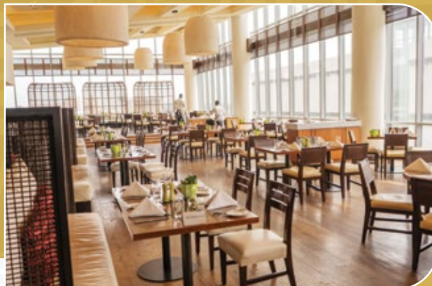
Hôtel Kempinski, Ghana