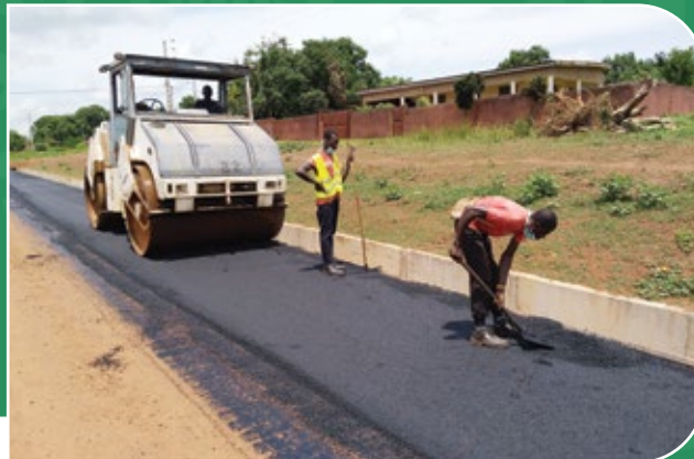
Route Tiébissou – Didiévi – Bocanda, Côte d'Ivoire