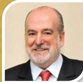
Ambassadeur Jean-Paul Carteron

Vice-Présidente Exécutive, Intra-African Trade Bank, African Export-Import Bank, Afreximbank