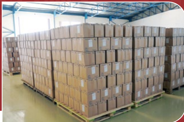
DO PHARMA Pharmaceutique, Togo