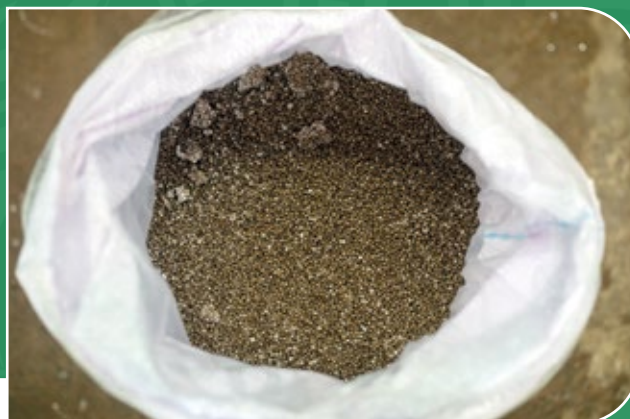
Usine de traitement d'engrais de Toguna, Mali